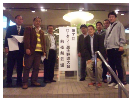
11月12日 福山にてロータリー選抜野球大会