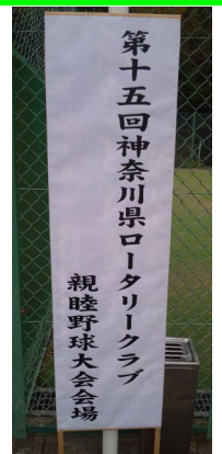
11月17日 飯山球場にて