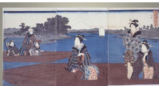
初代歌川広重 六郷渡し場の景