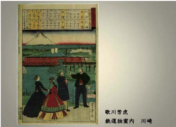
歌川芳虎 鉄道独案内 川崎