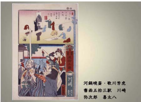
河鍋晩斎・歌川芳虎 書画五拾三駅 川崎 弥次郎 喜太八