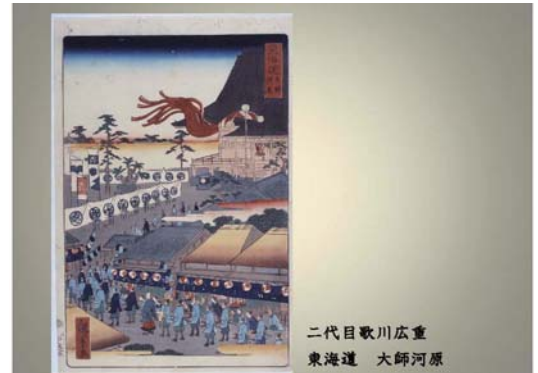
二代目歌川広重 東海道 大師河原

⑤・多摩川の浮世絵 調布の玉川・六郷の渡し・羽田の渡し・鉄道絵(六郷館) )・大師の浮世絵 “今も昔もお大師様”将軍の参詣