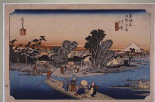
初代歌川広重 東海道五拾三次之内 川崎 六郷舟渡