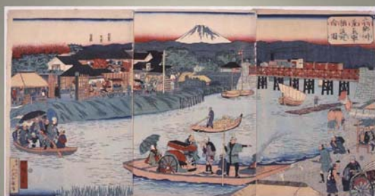
三代目歌川広重 六郷川蒸気車往返之全図