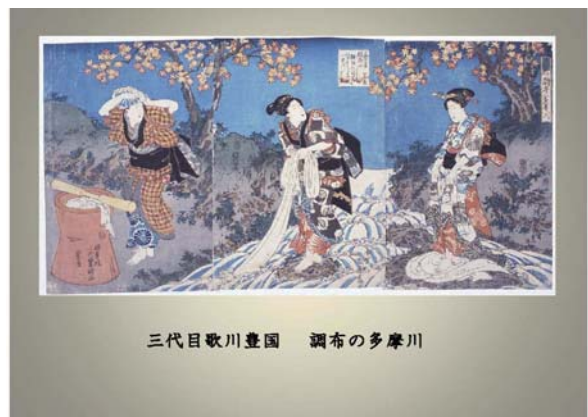
三代目歌川豊国 調布の多摩川