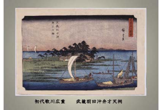
初代歌川広重 武蔵羽田沖舟才天祠