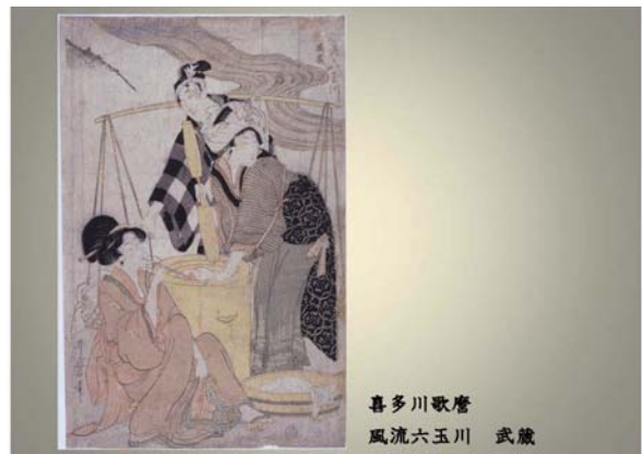
喜多川歌麿 風流六玉川 武蔵