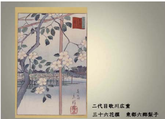
二代目歌川広重 三十六花撰 東都六郷梨子