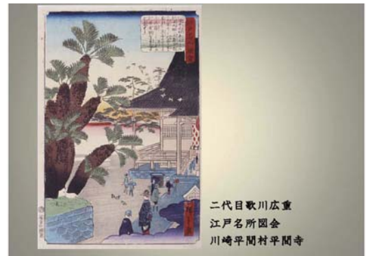
二代目歌川広重 江戸名所図会 川崎平間村平間寺