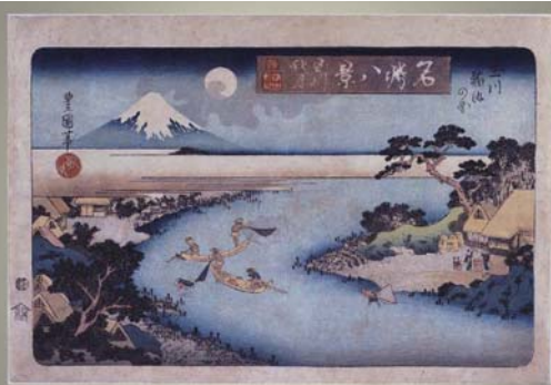
二代目歌川豊国 名勝八景 玉川秋月 玉川鮎沢の図