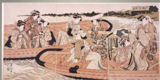
初代歌川豊国 六郷舟渡