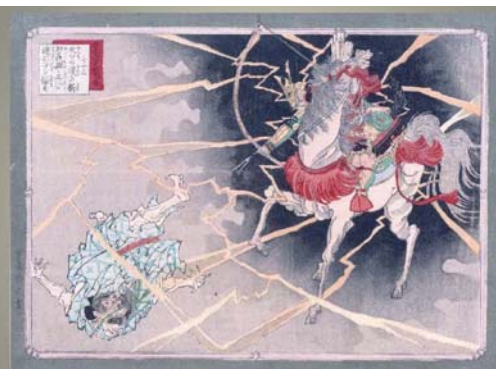
安達吟光 大日本国史略図会 七十三 矢口の渡