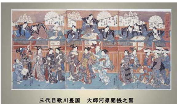
三代目歌川豊国 大師河原開帳之図

⑤・多摩川の浮世絵 調布の玉川・六郷の渡し・羽田の渡し・鉄道絵(六郷館) )・大師の浮世絵 “今も昔もお大師様”将軍の参詣