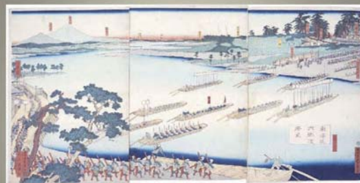
歌川貞秀 東海道六郷渡風景