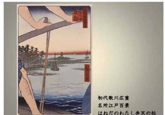
初代歌川広重 名所江戸百景 はねだのわたし弁天の社