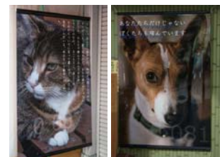
仲見世通 動物の顔に似せたい、似せたいと願っています。 2015