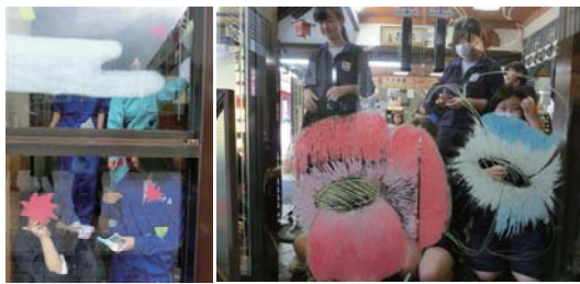
日本橋地区文化振興会2015「まがひのり」