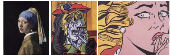
ヨハネス・フェルメール『真珠の首飾の少女』1665 350年前