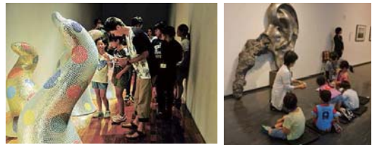
川中島小学校と大師小学校が授業として参加します 写真はイメージ