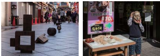
2015 10月9日 2015