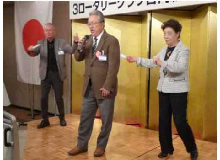
歌唱力はダントツでしたが、惜しくも優勝を逃しました。