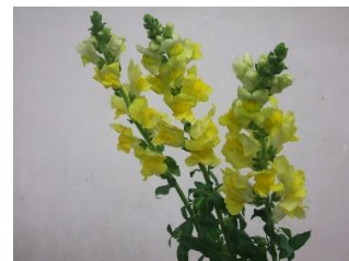
金魚草 (きんぎょそう)

花形が、金魚が口を開いているのに似ているのにもとづく。ヨーロッパ南部、北アフリカ原産で、花色も豊富である。