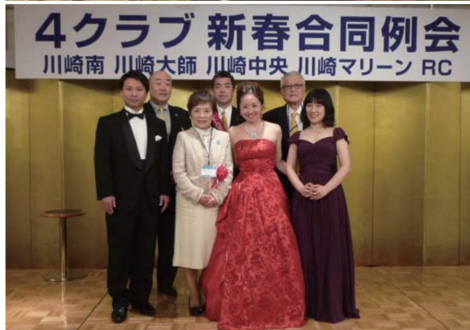
4クラブ 新春合同例会 川崎南 川崎大師 川崎中央 川崎マリーン RC

日時：平成30年1月24日(水)は 通常例会です。 第5回クラブ協議会 中間決算・年度収支見込下期事業