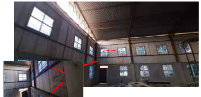
第四段階体育館建設状況：壁追加補強工事