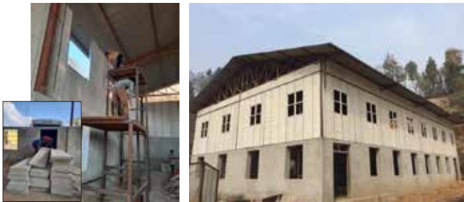
第四段階体育館建設状況：壁工事