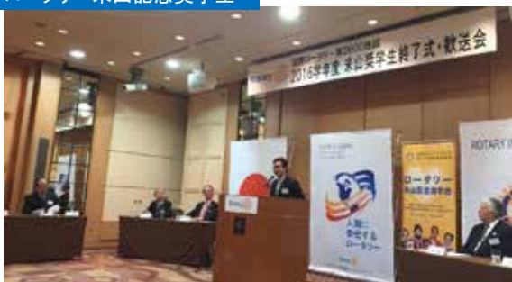
大学院の勉強の時にはロータリークラブには大変お世話になりました。