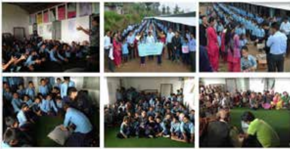
学生を対象に心肺蘇生法などの防災教育と他分野の紹介