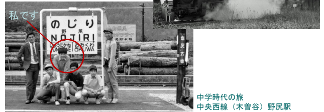
中学時代の旅 中央西線（木曾谷）野尻駅

昭和40年代後半、中学時代 蒸気機関車の最後の時期「SLブーム」 友人たちと長距離旅行を始める